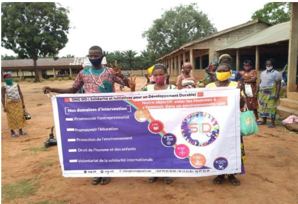
Formation en habillage textile avec les femmes de la commune de Misséréte