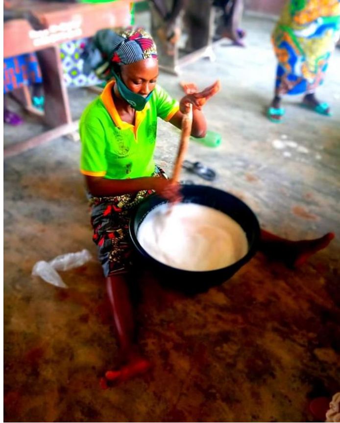
Formation avec les femmes d'Avagbodji sur les activités génératrices de revenus : Préparation du savon liquide.

Démarrage de la visite inopinée chez les bénéficiaires du PET le vendredi 07 Février 2020